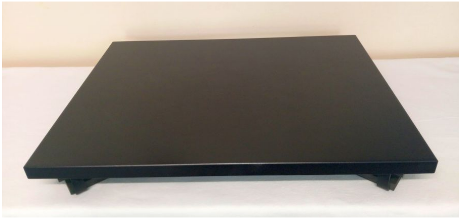
Abbildung: Ansicht der Oberseite (lackierte Ausf.)