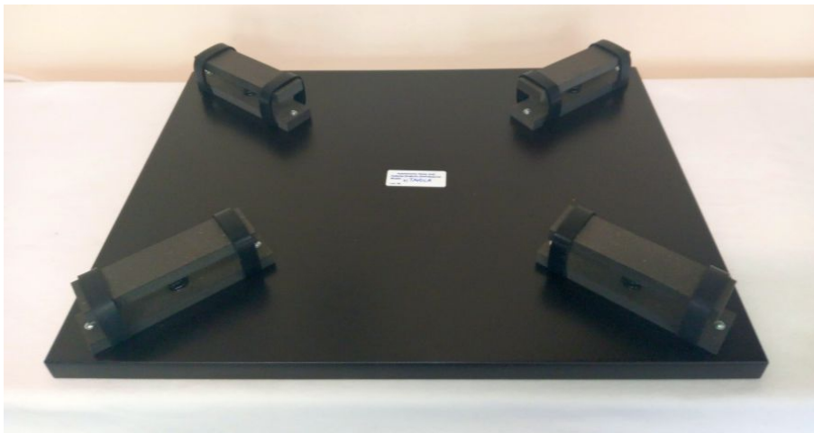
Abbildung: Ansicht Unterseite (lackierte Ausf.)